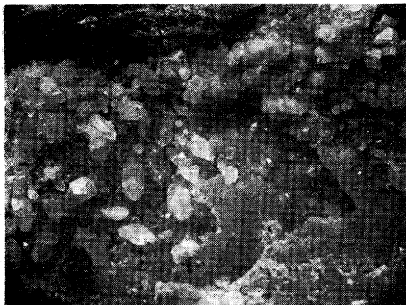
Рис. 1. Переотложенный кварц в золото-кварцевых жилах Енисейского кряжа: а) неясногребенчатые прожилки в сильно деформированном раннем кварце: прозр. шлиф, ник. X, увел. 6; б) друзовые корки на стенках пустот выщелачивания в кварцевой жиле. Фотообразцы, увел. 6

гостадийности рудоотложения, но, учитывая приведенные выше данные, они скорее могут считаться признаками неоднократного переотложения минерального вещества.