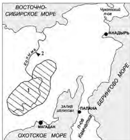
Рис. 1. Схема расположения р. Колымы по [5]: 1 — район наибольшей концентрации местоорождений россыпного золота; 2 — гидрологический пост р. Колыма у г. Среднеколымска

Формированию стока взвешенных наносов р. Колымы посвящено не так много работ [17, 19, 20, 21] и в них не прорабатывался вопрос влияния золотодобывающей промышленности на мутность рек. В данной работе ставится цель исследовать влияние добычи россыпного золота на многолетние колебания мутности воды в р. Колыме. В связи с этим встает задача провести совместный анализ динамики среднегодовой мутности и золотодобычи в речном бассейне.