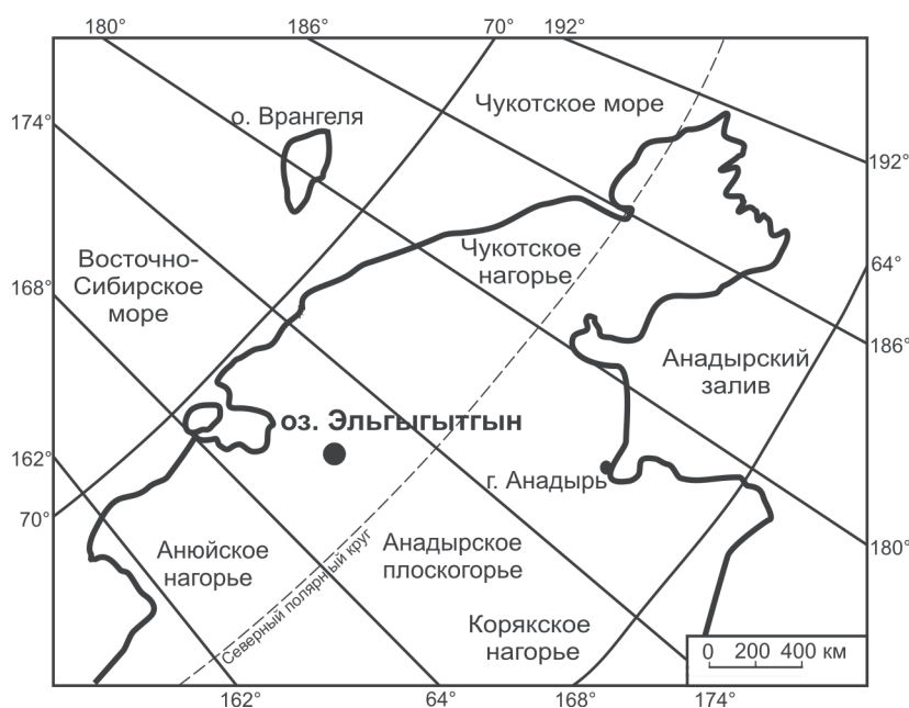
Рис. 1. Географическое положение оз. Эльгыгытгын

16,7 м, вскрывшая сравнительно монотонную толщу алевроитов (The Expedition..., 2005). Палинологический анализ осадков, вскрытых этими скважинами, убедительно показывает правильность палеогеографических построений.