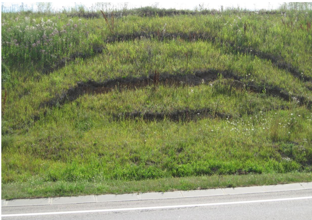
Рис. 2. Оползень на склоне выемки автодороги в Яковлевском районе Fig. 2. The landslide on the slope of the notch road in the Yakovlevsky district

Определенную роль в изменении рельефа сыграли реликтовые формы рельефа, к которым относятся курганы, земляные валы, оборонительные сооружения. Одной из самых древних реликтовых форм являются курганы. На территории области их было создано не менее 3000. К сожалению, в настоящее время курганов становится все меньше: большинство из них распаивается, а высота насыпей снижается со скоростью 1–3 см в год. Во время строительства Белгородской черты (1635–1658 гг.) было сооружено около 100 км земляных валов, из которых 21.2 км сохранилось до нашего времени.