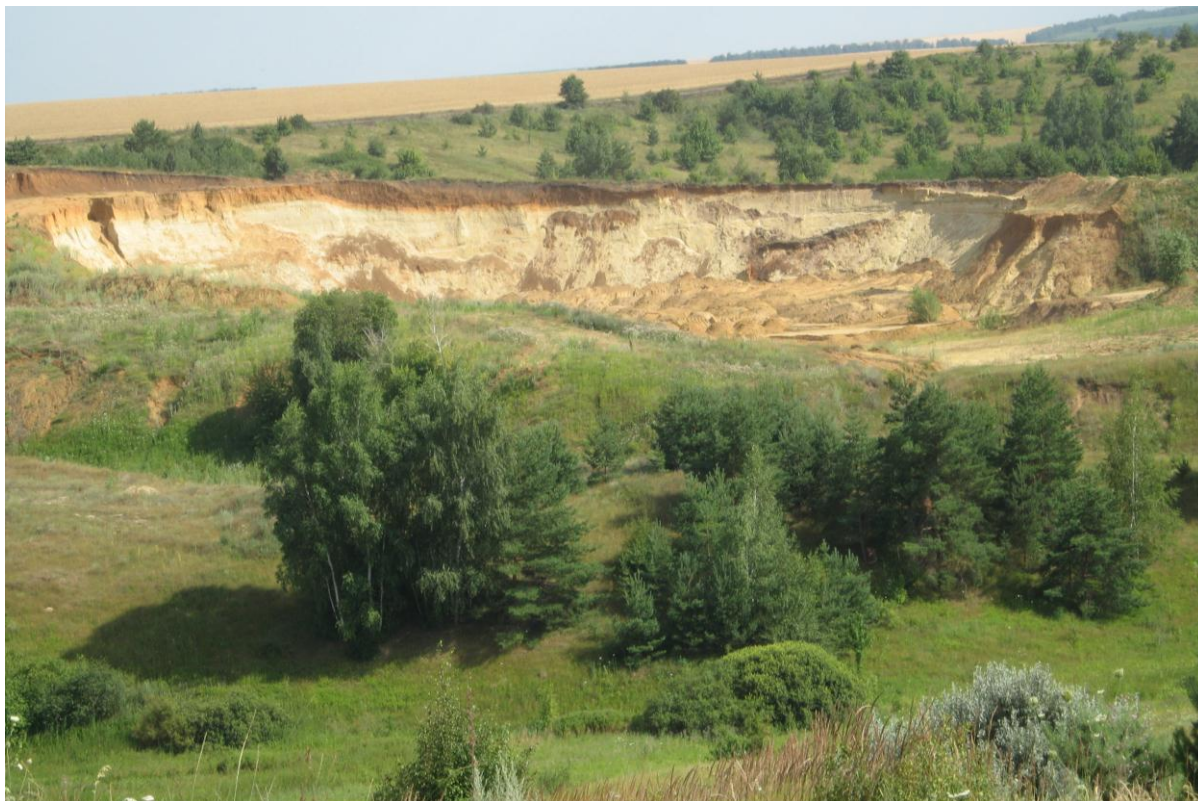
Рис. 1. Карьер по добыче песка в Борисовском районе Fig. 1. Quarry for the extraction of sand in the Borisovsky District

из них карьеров по добыче мела – 81, песка – 81, глины – 82. Четверть карьеров располагаются в поймах рек, примерно пятая часть из них – в оврагах и балках. Наибольшее число карьеров ОПИ находится в Красногвардейском районе (87), а наибольшие площади земель, занятых под карьерами, – в Белгородском районе (371.5 га).