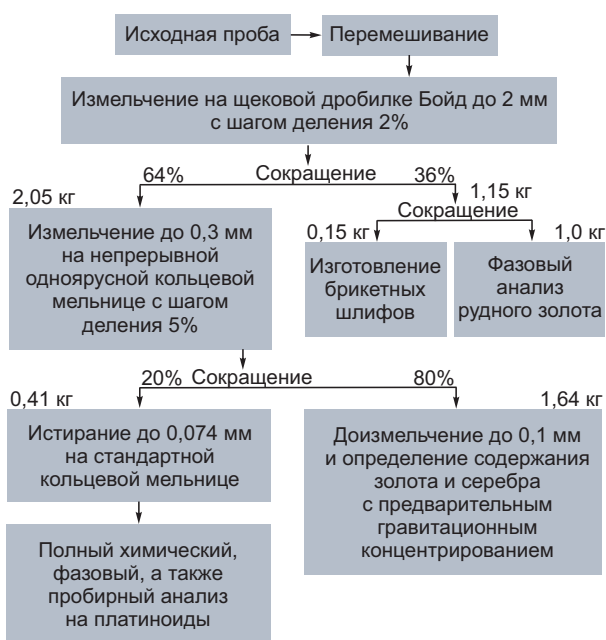
Рис. 2. ПРИМЕРНАЯ СХЕМА ОБРАБОТКИ ГРУППОВОЙ ПРОБЫ МАССОЙ 3,2 кг

рядовых проб и с учётом химического состава минералов, входящих в состав руды. Наиболее распространённый набор компонентов для определения химическим и фазовым анализами следующий: SiO_2 , Al_2O_3 , CaO , MgO , MnO , FeO , Fe_2O_3 , TiO_2 , K_2O , Na_2O , P_2O_5 , H_2O , п.п.п, CO_2 , Fe_{общ.} , Fe_{сульфид.} , S_{общ.} , S_{сульфид.} , Cu_{общ.} , Cu_{сульфид.} , Pb_{общ.} , Pb_{сульфид.} , Zn_{общ.} , Zn_{сульфид.} , As_{общ.} , As_{сульфид.} , Sb_{общ.} , Sb_{сульфид.} , Bi , Mo , Se , Te , Hg , C_{общ.} , C_{орг.} . При наличии платиноидов ( Os , Ir , Pt ) они определяются пробирным анализом.