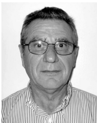
Ян Каган (Yan Y. Kagan).

А в 1967 г. в ИФЗ защитил кандидатскую диссертацию 32-летний Я.Я. Каган, представивший работу по локации акустических импульсов в горных выработках с целью исследования процесса разрушения горного массива. Уже в этой работе было сформулировано предположение о пространственном самоподобии дизъюнктивных нарушений в массиве горных пород. Я.Я. Кагану принадлежит знаменитое определение сейсмичности как «турбулентности в твердом теле» 1 , а в 1980 г. он (совместно с Л. Кнопоффом) показал факт наличия самоподобия в пространственных распределениях сейсмичности 2 , используя данные Южно-Калифорнийского сейсмологического каталога и методы теории корреляционного интеграла. Сегодня Я.Я. Каган (с 1974-го года живущий и работающий в США) – один из ведущих сейсмологов Калифорнийского университета в Лос-Анжелесе (UCLA), занимающийся исследованием нелинейных аспектов сейсмического процесса и вопросами сейсмического прогноза.