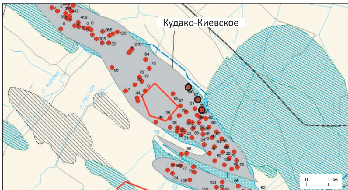
Рис. 6. Схема расположения скважин на Кудако-Киевском разрабатываемом месторождении Fig. 6. Well location map in the producing Kudako-Kievsky field