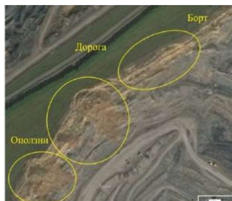
Рис. 1. Вид оползней борта карьера на карте Викимапии

Как показано в [3, 4], эрозионные разрушения в бортах карьера проявляются при морозобойном растрескивании грунтов и пород в краевой части массива, когда при промерзании сухих грунтов происходит их объемное уменьшение, сопровождающееся образованием трещин и щелей, ориентированных по глубине вертикально или под углами напластований (рис. 2). Пучение влагонасыщенных грунтов и разрушение пород при сезонном замерзании воды, скапливающейся в трещинах и порах вблизи поверхности обнажений, приводит к увеличению объема грунта до 10%, инициируя необратимые деформации в массиве.