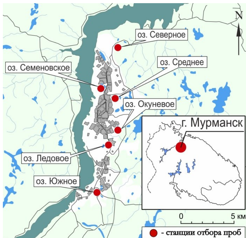
Рис. 1. Карта-схема расположения изучаемых озер Fig. 1. The quick map of the studied lakes

В 2019 г. совместно с Институтом озероведения РАН работы были продолжены. Из самых глубоководных частей четырех озер города Мурманска были отобраны колонки донных отложений (табл. ) с помощью проботборника Limnos для послойного (каждые 5 см) исследования химических форм ТМ.