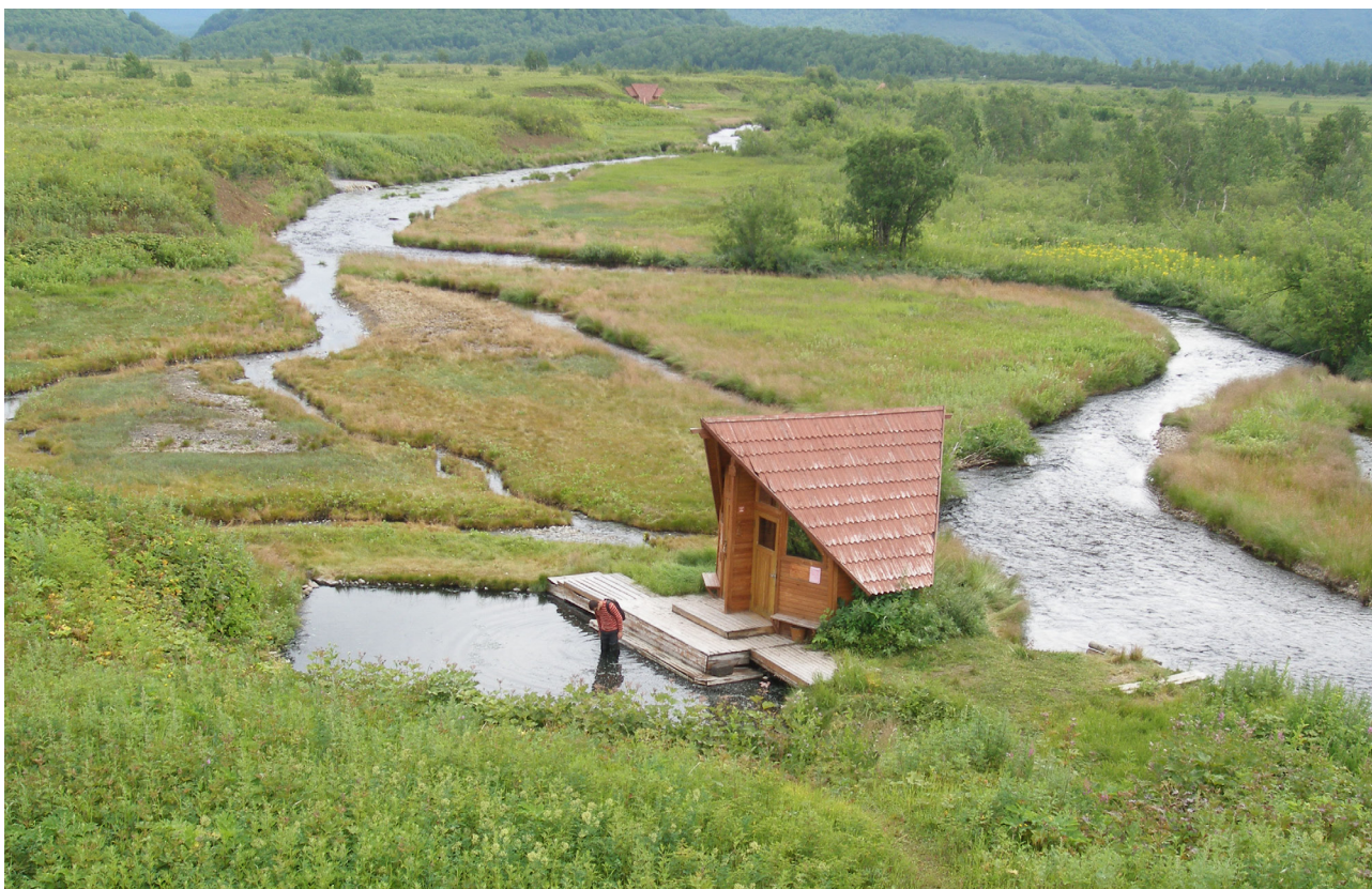
Рис. 3. Термальная площадка «Первая лужа».