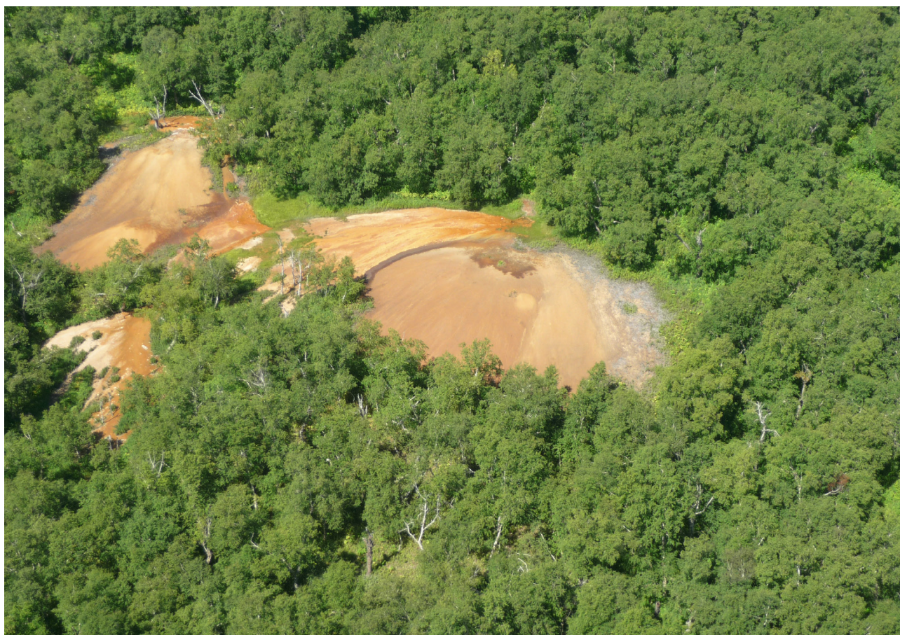
Рис. 4. Травертиновые купола Таловских термальных источников.

Необходимо отметить, что по непонятным причинам в последние годы Краеведческие источники на различных туристических схемах называют Таловскими и наоборот, Таловские источники называют Краеведческими. Мы считаем, что в ближайшее время, согласовав со всеми заинтересованными сторонами, источ-