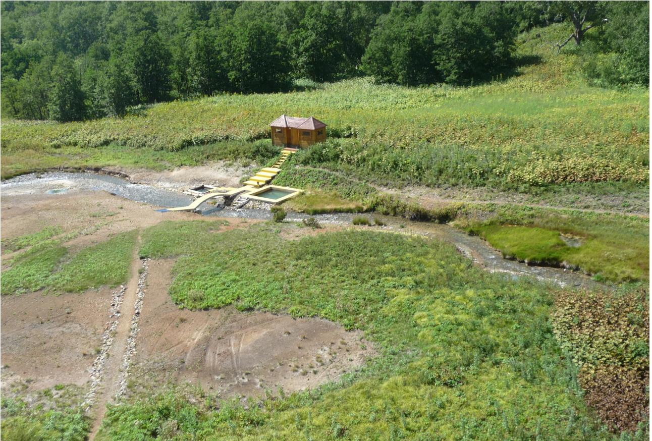
Рис. 5. Краеведческие термальные источники.

никам следует вернуть исторические названия на всех туристических схемах.