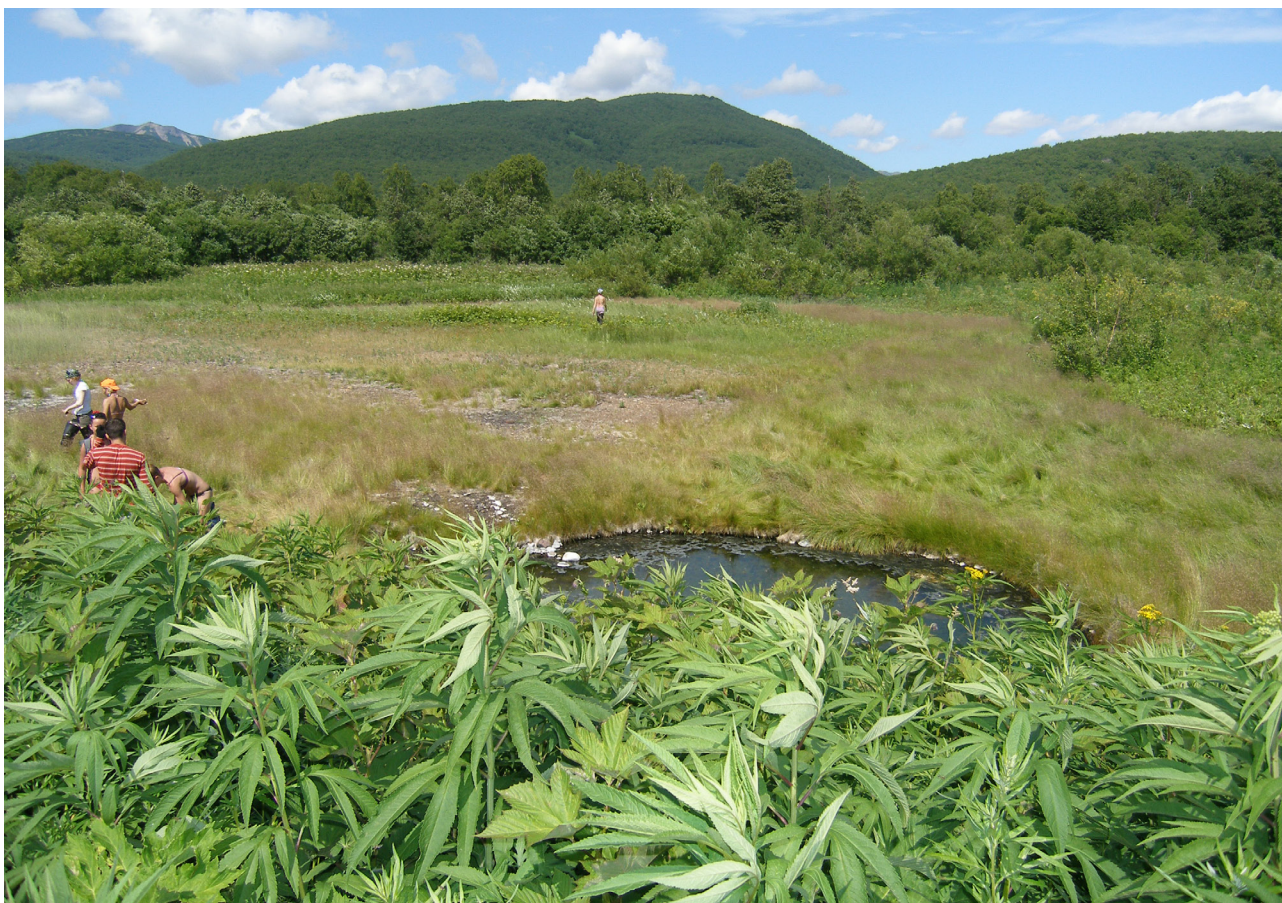
Рис. 2. Термальная площадка «Желтореченская».