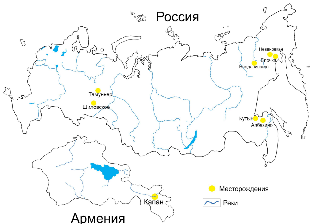
Местоположение изучаемых месторождений: Албазино, Елочка, Капан, Невенрекан, Нежданинское, Тамуньер, Пещерный / Location of the studied deposits: Albazino, Elochka, Kapan, Nevenrekan, Nezhdaninskoye, Tamunier, Peshherny

дисперсионном спектрометре «ARL Advant'X» фирмы «ThermoFisher Scientific» в ресурсном центре СПбГУ. Определения микроэлементов проводилось масс-спектрометрией с индуктивно связанной плазмой (ICP-MS) в лаборатории ЗАО «Центр исследования и контроля воды» на масс-спектрометре Agilent 7500с фирмы Agilent. Анализ на благородные металлы выполнен пробирным методом в лаборатории ЗАО «Механобр инжиниринг аналит».