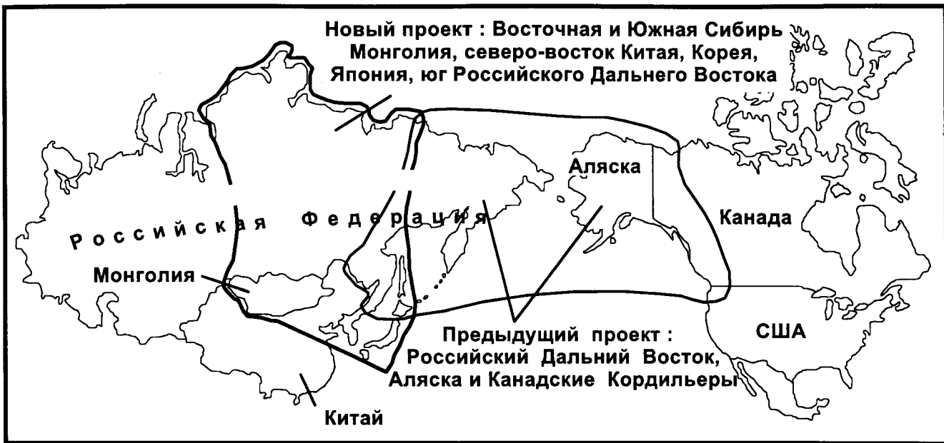
Рис. 1. Регионы, охватываемые предыдущим проектом по тектонике и металлогении севера тихоокеанского обрамления и новым проектом по тектонике и металлогении Северной и Центральной Азии, Кореи и Японии.

В 80-е годы были составлены и опубликованы карты террейнов Аляски и Кордильер Северной Америки [21, 22, 30, 32] и ряда других регионов [17]. Карты террейнов выгодно отличаются от сходных с ними геодинамических карт, которые во многом повторяют контуры геологических карт, тем, что на них изображена мозаика главных тектонических единиц орогенных поясов, тектоническое совмещение которых привело к формированию данного орогенного пояса.