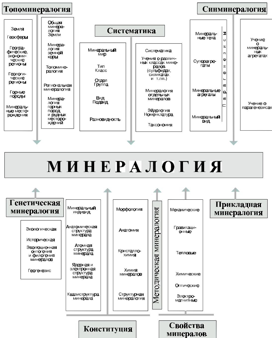
Рис. 1. Структура минералогии

Современная структура минералогии отражает установившиеся методологические подходы к изучению минеральных индивидов и их естественных сообществ и концептуальных совокупностей (рис. 1). Она включает следующие главнейшие направления: