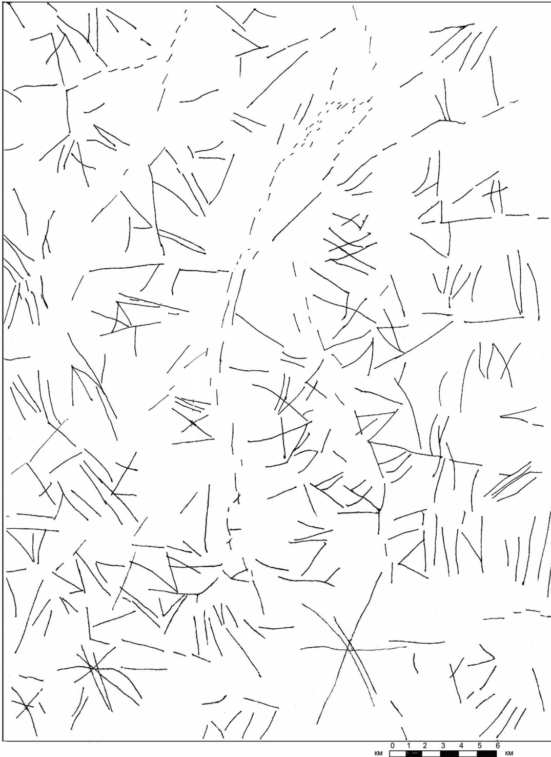
Рис. 2. Карта линеаментной сети для района Паратунской долины.

Хорошо выражены разнопорядковые и разновременные кольцевые структуры. Отчётливо видны системы распадков и водоразделов, образующих радиально-концентрическую систему, в эпицентральной части которой расположен субмеридионально вытянутый грабен р. Паратунки (рис. 3). Кроме того, в парагенезисах линеаментов