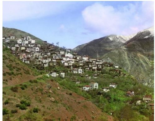
Рис. 2. Общий вид Артвина с местечка Свет. Март 1912 г. С. М. Прокудин-Горский.

Батумская область оказалась в составе Российской империи лишь 6 лет ранее того, по результатам Русско-турецкой войны 1877–1878 гг. В 1883 году Батумская область была включена в состав Кутаисской губернии (Брокгауз, Ефрон 1890–1907). На ее территории существовало два пограничных округа, управлявшихся наряду с гражданской еще и военной администрацией, – Батумский и Артвинский. Как раз рядом с административным центром последнего городом Артвин и расположено место, которое стало источником минералов платиноидов, добытых Черником. Увидеть, как Артвин выглядел в начале XX века, можно на уникальных цветных снимках пионера цветной фотографии в России Сергея Михайловича Прокудина-Горского (рис. 2), побывавшего здесь в марте 1912 г. (Наследие С.М. Прокудина-Горского).