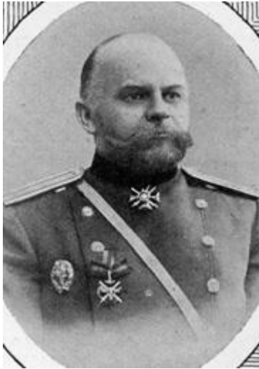
Рис. 1. Георгий Прокофьевич Черник (1864–1942).

качественного и количественного анализа, тем более, что я имел решить в то время вопрос лишь принципиально: заключает ли шлах сколько-нибудь значительное количество золота... содержание ценных металлов было настолько мало, что не может быть и речи о сколько-нибудь неубыточной эксплуатации шлахов... Все они получены из залеженных в различных местах и на разных глубинах шурфов, и все дали приблизительно одинаково неутешительные результаты.