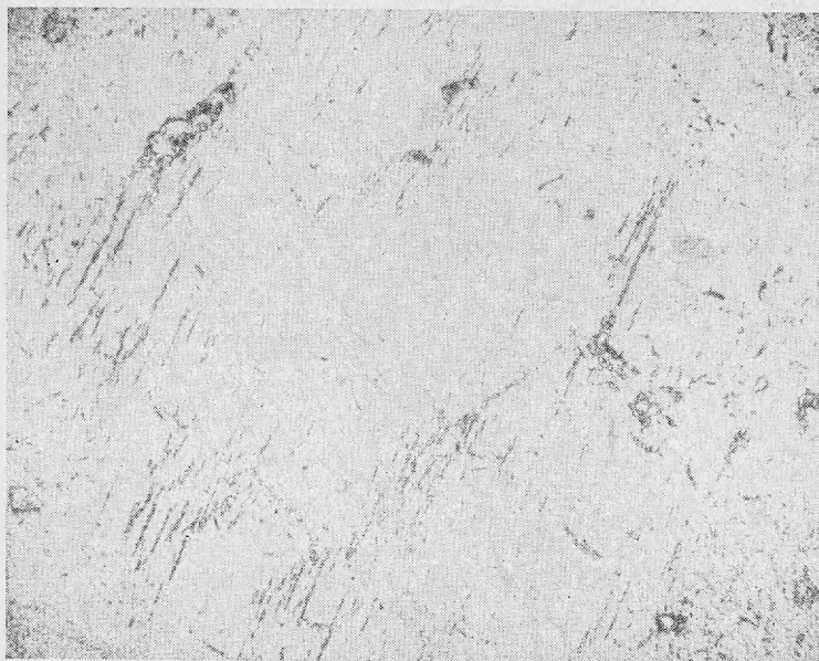
Рис. 3. Трещины спайности минерала, замещенного гидрогроссуляром. Увел. 18, один николь

отвечающих деформационным колебаниям гидроксила. Это связано с положением гидроксильных групп в структуре. Располагаясь по граням бывшего Si-тетраэдра, они оказываются связанными с кальцием или алюминием, что влечет сдвиг частоты деформационного колебания O—H—Ca и O—H—Al в область колебаний основных структурных связей.