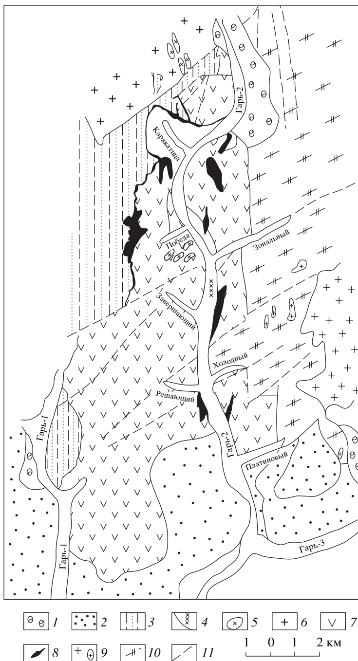
Рис. 2. Схематическая геологическая карта участка Гарь-2. 1–3 – стратифицированные отложения: 1 – четвертичные, 2 – неоген-четвертичные, 3 – средне-верхнеюрские (усманковская свита); 4 – обломки листвеников на площади дражного полигона; 5 – дайки раннемеловых гранитоидов; 6 – позднепалеозойские биотитовые граниты ( \gamma PZ_3 ); 7 – офиолиты и аповулканитовые метаморфические сланцы ( PR_2 – PZ_1 ); 8 – серпентиниты (апогарцбургитовые, реже аподунитовые) среди офиолитовых вулканитов ( PR_2 – PZ_1 ); 9 – позднеархейские граниты ( \delta AR_2 ); 10 – гнейсы, кристаллические сланцы, кварциты ( AR_2 ); 11 – зоны дробления и расщепления пород.

ной платиной, лауритом-эрлихманитом ( Ru, Os ) S_2 в трещинах агрегатов рутениридосмина и ферроплатины. Как известно [9], растворимость Ir в золоте мала. Вероятно, поэтому в составе изученной фазы просматривается тенденция роста со-