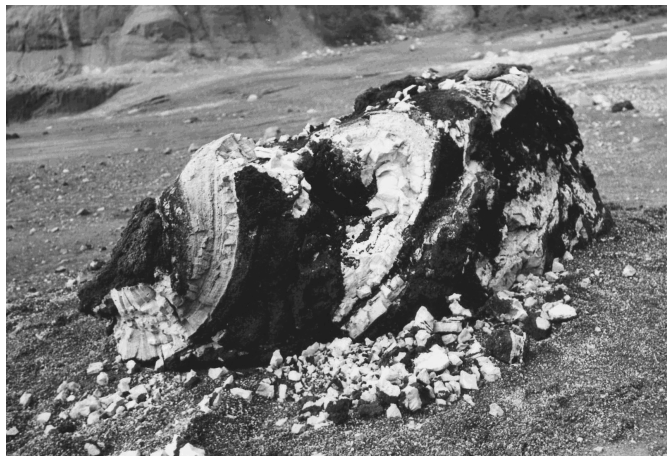
Рис.1. Риолитовая бомба в базальтовой «рубашке». I тип пористости.

породу на клинообразные микроблоки. Большой частью трещины открытые, образованные в результате охлаждения, некоторые из них выполнены белым плотным веществом. Белый налет отмечается иногда и на поверхности крупных пор. Предполагается, что это белое вещество представляет собой гелеобразный кремнезем, который отлагался из нагретой до высоких (порядка 250°С) температур воды Карымского озера. Отличительной особенностью таких пемзовых бомб является наличие базальтовой «рубашки» и шлакоподобных включений, которые соответствуют по составу основной массе изверженных базальтов. (рис. 2 на 4-й странице обложки).