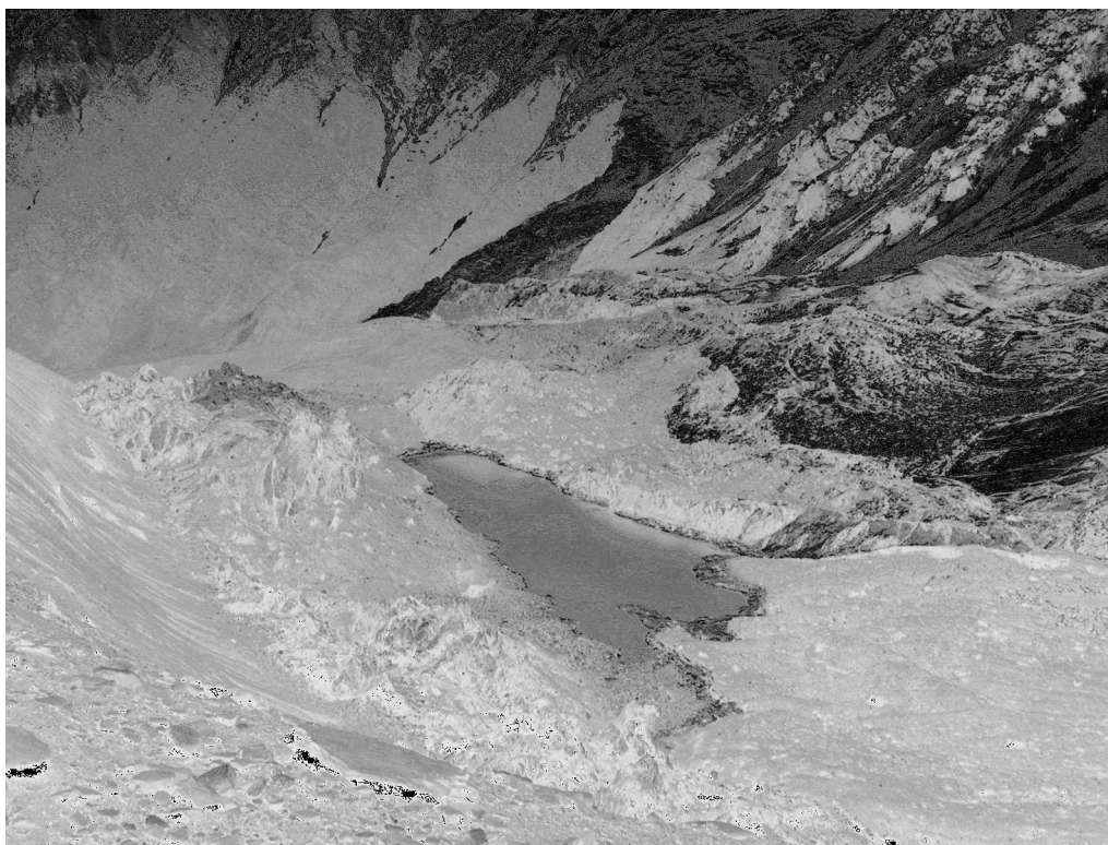
Рис. 2. Озеро на леднике Колка выше ригеля цирка с повышенной минерализацией воды в ноябре 2002 г.

Воды колкинского цирка после схода ледника похожи по макрокомпонентному составу на шахтные воды ряда рудных месторождений Северной Осетии, а из минеральных источников - близки водам Тамисского месторождения (табл. 3). Состав всех источников этого месторождения однотипного сульфатно-кальциевого состава. Объясняется этот состав аномально высоким содержанием сульфидов в известняках района. Выходы вод структурно приурочены к блоку, ограниченному субширотными тектоническими нарушениями с интенсивно развитой трещиноватостью. Областью питания, кро-