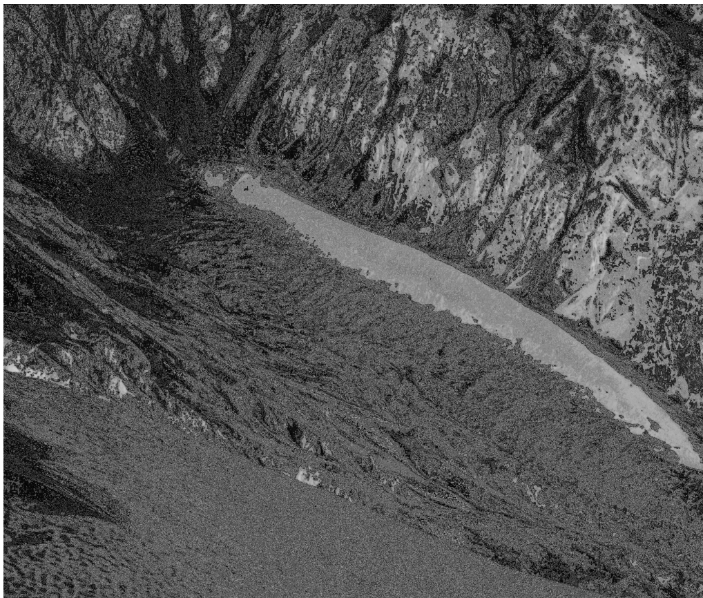
Рис. 4. Строение поверхности ледника Колка в верховьях долины после подвижки 1969-70 года. На боковой морене, прислоненной к левому борту, четко прослеживается уровень понижения поверхности ледника в результате оттока льда из верховьев цирка. Апрель 1970 г.

2003; Поповнин и др., 2003 и др.). В современной гляциологии выделяется класс ледников (т.н. “пульсирующие”), периодические колебания которых зависят не от внешних воздействий (например, климатических изменений), а от динамических процессов, происходящих в самом леднике. При минимуме внешних воздействий (крупных обвалов висячих ледников, сильных землетрясений в пределах горста Центрального Кавказа, метеорологических аномалий, связанных с температурами воздуха и водой в леднике) обычно пульсационный цикл ледника в пределах периода 65-70 лет завершается большими подвижками, подобными 1969-70 гг. Особенность подобных «классических» пульсаций (сердечей) - неполное срабатывание ледоема в колкинском цирке (рис. 4). Это существенно, чтобы понять события 2002 г.