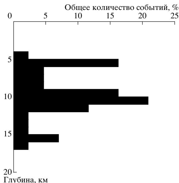
Рис. 2. Распределение гипоцентров афтершоков по глубине.

6. В первые сутки после главного толчка работала мощнейшая серия афтершоков по периметру Чаган-Узунского блока. Подвижка на одном крае