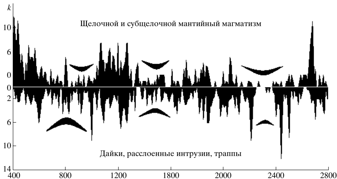
Рис. 2. Совпадение этапов исчезновения или минимизации проявления щелочного–субщелочного и базит-гипербазитового магматизма (млн. лет) с глобальными циклами резкого снижения мантийной активизации (овалы) (рис. 1).

гии щелочного магматизма (1057 датировок) и комплексов дайковых серий, траппов, коматиитов и расслоенных интрузий (714 датировок) указывает на согласованность изменений в активизации щелочного и базит-гипербазитового магматизма с картиной глобального неравномерного развития мантийного магматизма на Земле (рис. 2).