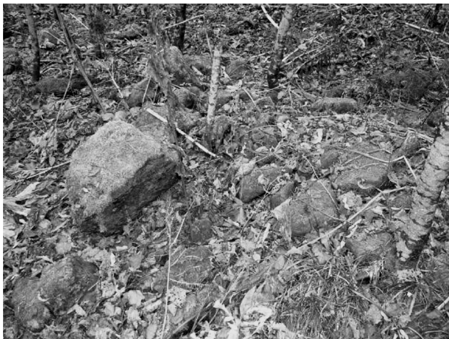
Рис. 3. Отложения грязекаменных селей в бассейне р. Рогатка.