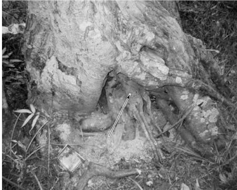
Рис. 5. Селевые сбитости на стволах деревьев, произрастающих на селевых отложениях в селевом бассейне р. Рогатка.

Спилы, взятые с деревьев с селевыми сбитостями. По спилам с этих деревьев год прохождения селя можно установить с погрешностью в 1–2 года (в связи с неточностью при подсчете числа годовичных колец).