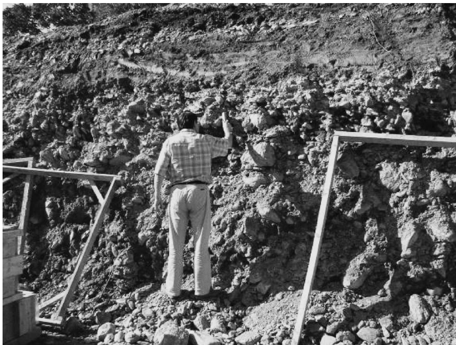
Рис. 1. Отложения грязекаменных селей р. Рогатка на территории Южно-Сахалинска.

Среднегодовое количество осадков в бассейне р. Рогатка по данным суммарных осадкомеров составляет от 822 мм (в приустьевой части) до 2000 мм (у истоков). Зарегистрированный максимум осадков (6.08.1981 г.) составил по данным гидрометеорологической станции «Южно-Сахалинск» (абс. высота 22 м) – 220.0 мм; по суммарному осадкомеру № 26 в бассейне р. Рогатка (абс. высота 320 м) – 430.5 мм [1].