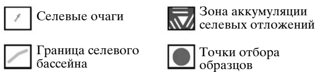
Рис. 2. Селевой бассейн р. Рогатка.