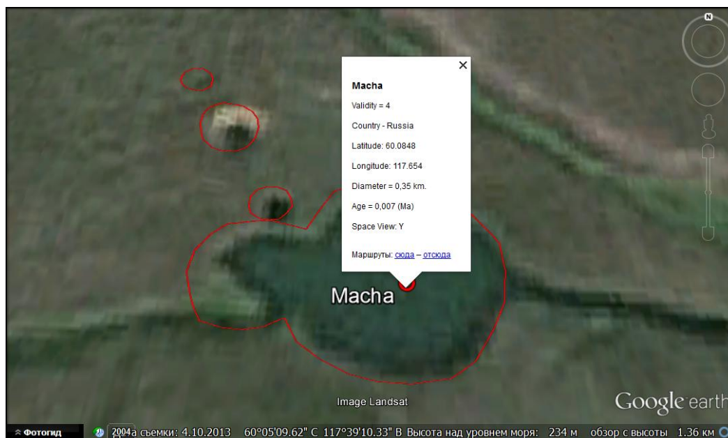
Рис. 4. Визуализация кратерного поля Мача (Россия, Якутия)

В заключение отметим, что в отличие от Интернет-ресурсов [6,8,9] созданная база данных позволяет удаленному пользователю проводить аналитическую работу с данными (выборку и сортировку по заданным критериям), просматривать текстовую и графическую информацию, осуществлять пространственную визуализацию структур. База данных поддерживается в актуальном состоянии и регулярно пополняется новой информацией.