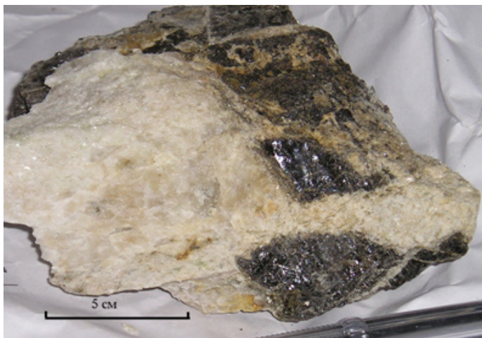
Рис. 2. Крупный кристалл иттроэпидота сечется агрегатом мелкозернистого альбитита, развивающегося по анортоклазиту (жила № 3, Слюдяногорское месторождение, Уфалейский комплекс)

речнике и находятся в сахаровидном альбите. Цвет минерала черный, на отдельных участках наблюдаются буровато-красные внутрен-