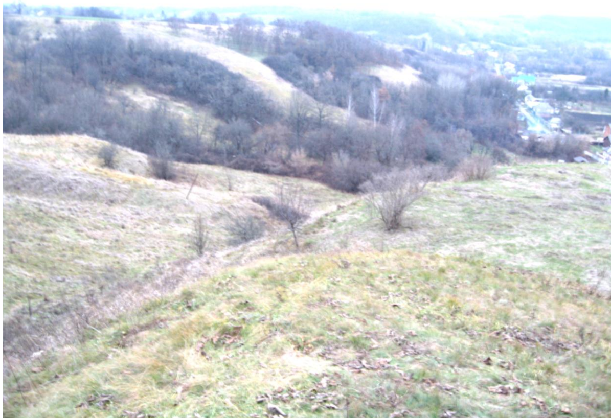
Рис. 2. Неотектонические структуры, видоизмененные эрозионно-денудационными процессами в Борисовском районе