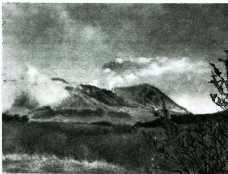
Фиг. 1. Вулкан Шевелуч.

Исследование вулканов Камчатки дает возможность довольно полно познать их строение, состав слагающих пород и характер извержений, а затем судить о процессах дифференциации магмы в вулканическом очаге на разных стадиях развития вулканов. Этот столь важный и интересный вопрос в геологии не является вполне разрешенным, потому что имеется значительный пробел в длительных наблюдениях за действующими