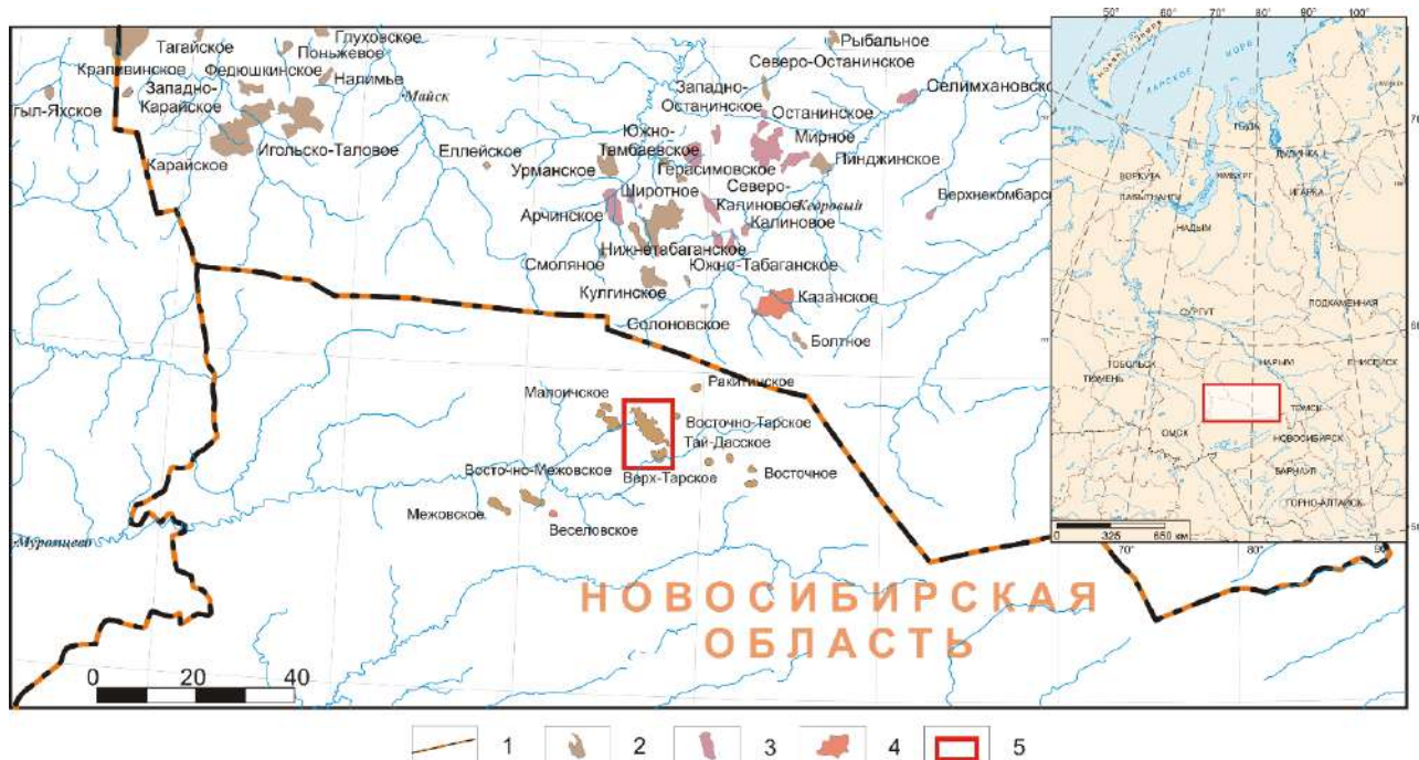
Рис. 1. Обзорная карта района исследований:

от 04.10.2001 г. месторождение разрабатывалось в соответствии с «Дополнение к уточненной технологической схеме разработки Верх-Тарского месторождения». В 2006 г. была утверждена «Технологическая схема разработки Верх-Тарского нефтяного месторождения». По состоянию на 01.01.2009 г. был выполнен «Оперативный подсчет запасов нефти и растворенного газа по пласту Ю 1 1 Верх-Тарского месторождения», который был утвержден Федеральным Агентством по недропользованию (Протокол № 18/48 от 06.02.2009 г.).