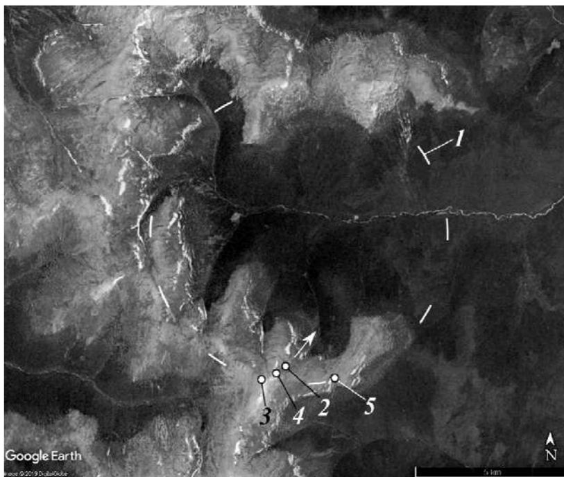
Рис. 2. Район гибели группы Дятлова [25]:

На рис. 2, 3 представлены космические снимки областей, в которых разыгрались трагедии 1959 и 1993 гг. В данном случае произошли они на контуре эндогенных, по определению [27] «неправильных», кольцевых структур, точнее на следе их мощностью m цилиндрической полосы скольжения. Судя по высоте горных сооружений, насаженных на него и обрамляющих эти концентры, последние гораздо моложе пенепленизированного КС-образования 3 на рис. 1. Район Урала с семейством эндогенных кольцевых морфообразований, включающим структуру 1, на которой погибла группа Дятлова (см. рис. 2), характеризуется рассеянной сейсмичностью [28]. Хамар-Дабан с его хорошо распознаваемым семейством из КС-образований 1, 2 (см. рис. 3), расположен на сейсмически активном юго-западном фланге Байкальской рифтовой системы [29]. Охотниками, геологами, туристами, а также жителями отдаленных селений при опросах, связанных с происшествиями 1959, 1993 гг., упоминались наблюдавшиеся в разное время над местом их реализации непонятные световые эффекты. Таким образом, из изложенного следует, что в целом сейсмотектоническая обстановка рассматриваемых регионов подобна сложившейся в области г. Сасово.