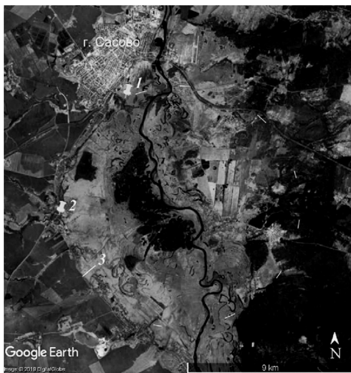
Рис. 1. Район Сасовского события [4]:

Эпицентр Сасовского взрыва, обозначивший себя кратером 1 диаметром D \approx 30 и глубиной \sim 3 м (рис. 1), имел координаты \sim 54^{\circ}19'55'' с.ш., 41^{\circ}55'35'' в.д. Породы были выброшены из него на расстояние до 300 м, их отдельные куски, падая, образовали на поверхности лунки и вмятины. Новообразование оказалось осложненным центральной горкой. Она – характернейший структурный элемент лунных кратеров, которые, несмотря на имеющиеся у них противоречащие этому особенности [5], считаются экзогенными (ударными) [6].