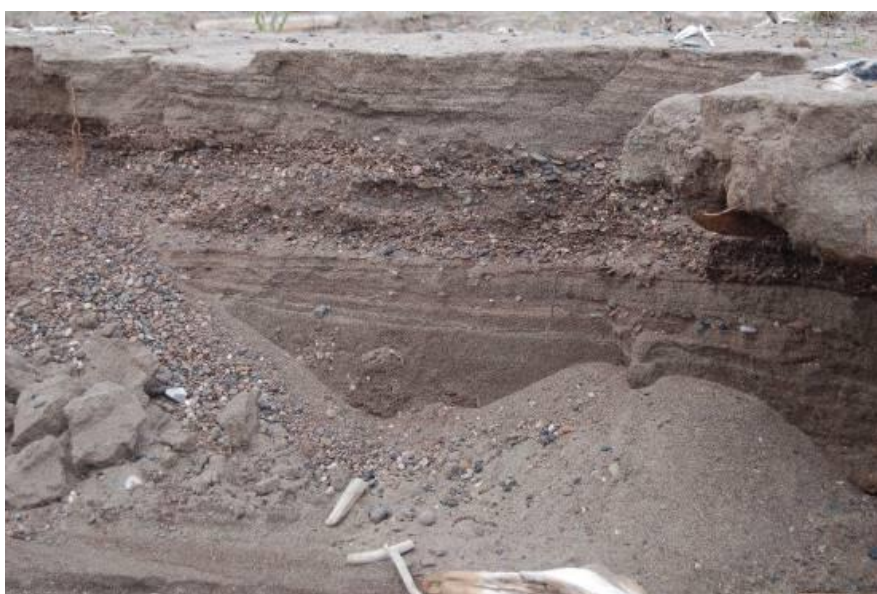
Рис. 3. Гравийно-галечный материал в отложениях прибрежной зоны Камского водохранилища Fig. 3. Gravel and pebble material in the sediments of the coastal zone of the Kama Reservoir

К настоящему моменту накоплен обширный фактический материал и по вопросам формирования донных отложений в глубоководной зоне равнинных водохранилищ, что дало возможность определить основные закономерности осадконакопления и формирования грунтового комплекса искусственных водоемов [3–5; 9; 22; 26; 27; 33].