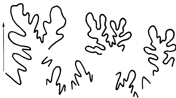
Рис. 4. Лопастная линия Ptychophylloceras tenuicostatum sp. nov.; экз. № 36/334 при В = 8.5 мм (×8); Восточный Крым, Феодосия, мыс Ильи; берриас, зона Berriasella jacobii–Pseudosubplanites grandis .

Скульптура. Взрослые раковины при Д = 23–50 мм на вентральной стороне несут 5–6 невысоких поперечных валиков, исчезающих не доходя середины боковой стороны. Валики пересекают вентральную сторону прямо либо с небольшим изгибом вперед. Вокруг пупка им соответствует