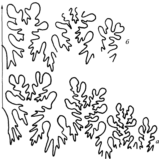
Рис. 3. Лопастные линии Ptychophylloceras semisulcatum (d'Orb.); а – экз. № 26/334 при В = 23.5 мм (x3); Восточный Крым, пос. Наниково; берриас, зона Berriasella jacobii – Pseudosubplanites grandis ; б – экз. № 2358 при В = 8.0 мм (x8); Центральный Крым, пос. Козловка; берриас.

разделения видов, и по этой причине не признал виды, описанные Бенекке и Оппелем.