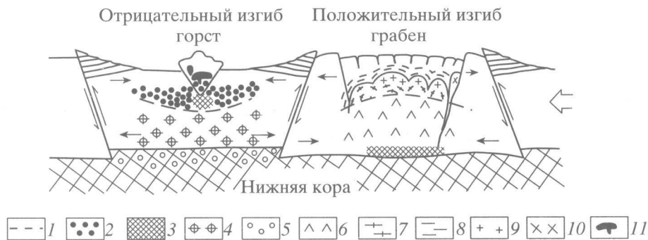
Рис. 1. Схема развития сопряженных положительных и отрицательных изгибов верхней коры. 1 – нейтральная поверхность; 2 – зона сжатия и зеленосланцевого метаморфизма; 3 – область плавления пород; 4 – область растяжения верхней коры; 5 – область растяжения нижней коры; 6 – область сжатия и высокотемпературного метаморфизма; 7 – гнейсы; 8 – метаморфическое обрамление; 9 – анатектические граниты; 10 – интрузивные плагиограниты; 11 – бескорневые малые интрузии.