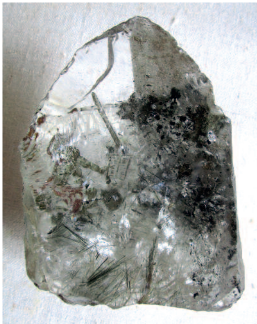
Рис. 1. Образец кварца из коллекции кристаллов Минералогического музея им. А.Е. Ферсмана. Бразилия. 12 см. ММФ №К31.