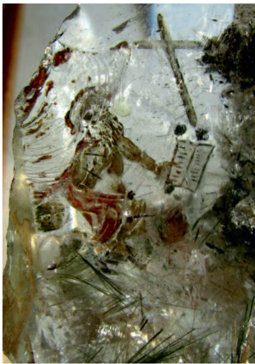
Рис. 2. Изображение гравировки на кварце со стороны обработанной поверхности (слева) и вид через толщину горного хрусталя (справа).

Это весьма почитаемый западным христианством один из четырех «римских отцов церкви» святой Иероним Стридонский (342–420) — церковный писатель, аскет, создатель канонического латинского текста Библии, из-за чего он получил еще и «должность» небесного покровителя переводчиков. К тому же выводу пришли и иконописцы, которым были показаны фотографии гравировки на кварце (Семенов, 2015).