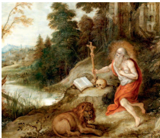
Рис. 4. Картина Франса Франкена Младшего «Святой Иероним со львом в пейзаже с руинами». Фрагмент. 20-е годы XVII века (сайт www.dorotheum.com ).

грудь на молитве, и конечно — тоже почти всегда неизбежная — раскрытая перед святым большая книга».