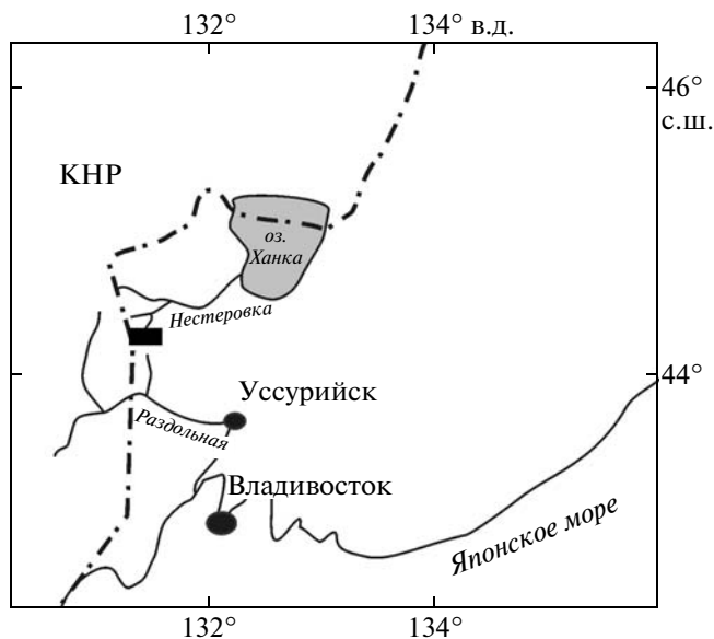
Рис. 1. Местоположение Фадеевского рудно-россыпного узла.

Авторами были изучены гравитационные концентраты крупнообъемных проб рудных образований и делювия бассейнов рек Поликарпиха и Толстокулачиха, правых притоков р. Золотая. Применение методов сканирующей электронной микроскопии позволило выявить на поверхности зерна ильменита, одного из основных минералов этих концентратов, примазки наноразмерных обособлений природного ртутистого золота (рис. 2а). Доминирующую роль в их кристаллизации играет пленка, фрагментарно покрывающая поверхность отдельных кристаллов ильменита. Размеры фрагментов достигают 60–80 мкм при толщине 100–200 нм. Элементный состав пленочных наноматериалов (табл. 1) довольно необычен: помимо Au (85–88 мас. %) и Hg (3–5 мас. %), определяющих видовой состав индивидов, в них присутствуют N, C, O, Ti и Fe в количествах, не превышающих первые мас. %. Металлические пленки