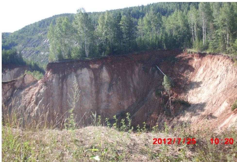
Рис. 4 - Зона обрушения, сформировавшаяся в 2012 г.

Следовательно, можно заключить, что геологическая среда рассматриваемого массива под воздействием техногенных напряжений вызывает перераспределение естественных напряжений, и весь этот комплекс оказывает негативное влияние на межблоковые связи. Отсюда по результатам инструментальных измерений наблюдаются разного рода «нестандартные» величины горизонтальных сдвижений и знакопеременный характер напряженно-деформированного состояния массива.