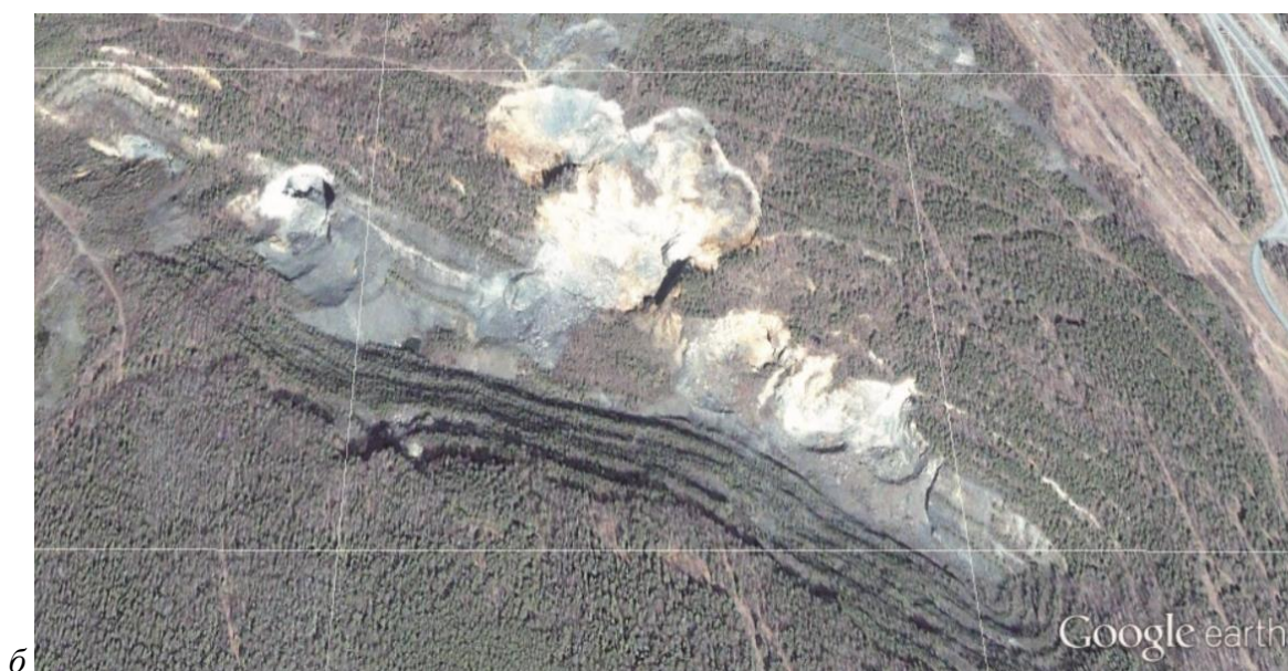
Рис. 3 - Космический снимок территории Естюнинского месторождения: a – до обрушения 2012 г.; б – после обрушения 2012 г.