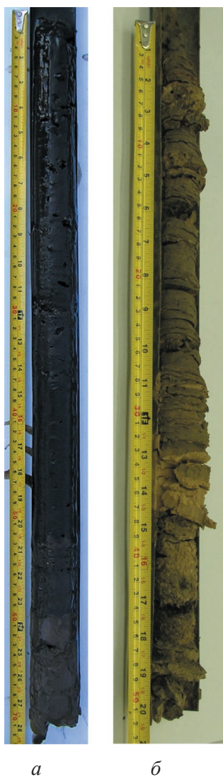
Рис. 3. Керны донных отложений оз. Рабига-Куль в естественном (а) и высушенном (б) состоянии

уровне 30% по массе. В средней части керна отложения сменяются более плотным коричневым илом с нечеткой слоистостью; здесь выделялись отдельные годовые слои мощностью от нескольких миллиметров до нескольких сантиметров. Нижняя часть керна с глубины 53 см состоит из более плотных светлых буровато-коричневых глинисто-илистых осадков.