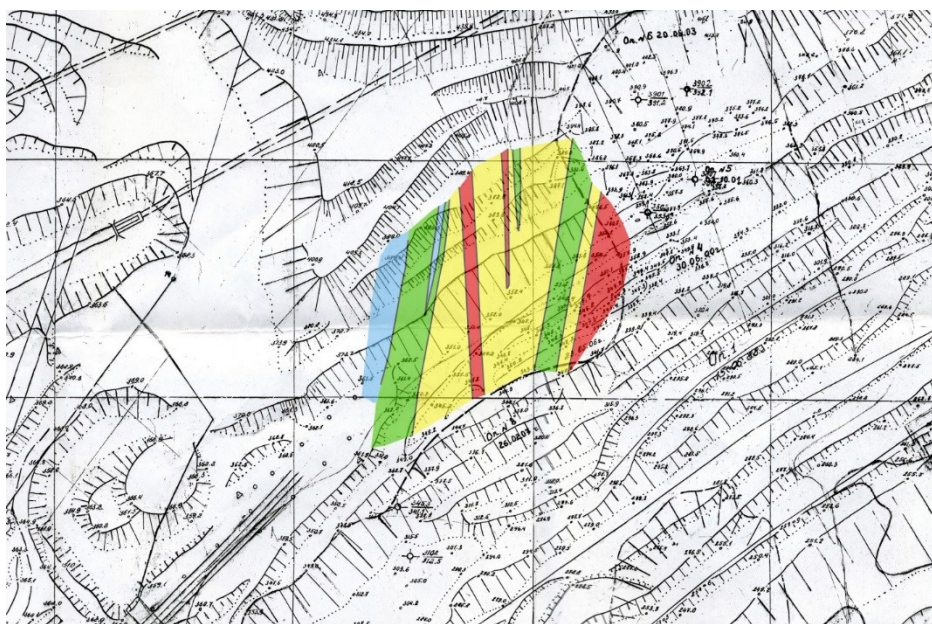
Рис. 2 – Результаты радонометрических исследований на Северном борту Коршуновского карьера

незначительном встряхивании. По результатам эманационной съемки в оползневой зоне были выявлены две подвижные системы разрывных нарушений (рис. 2).