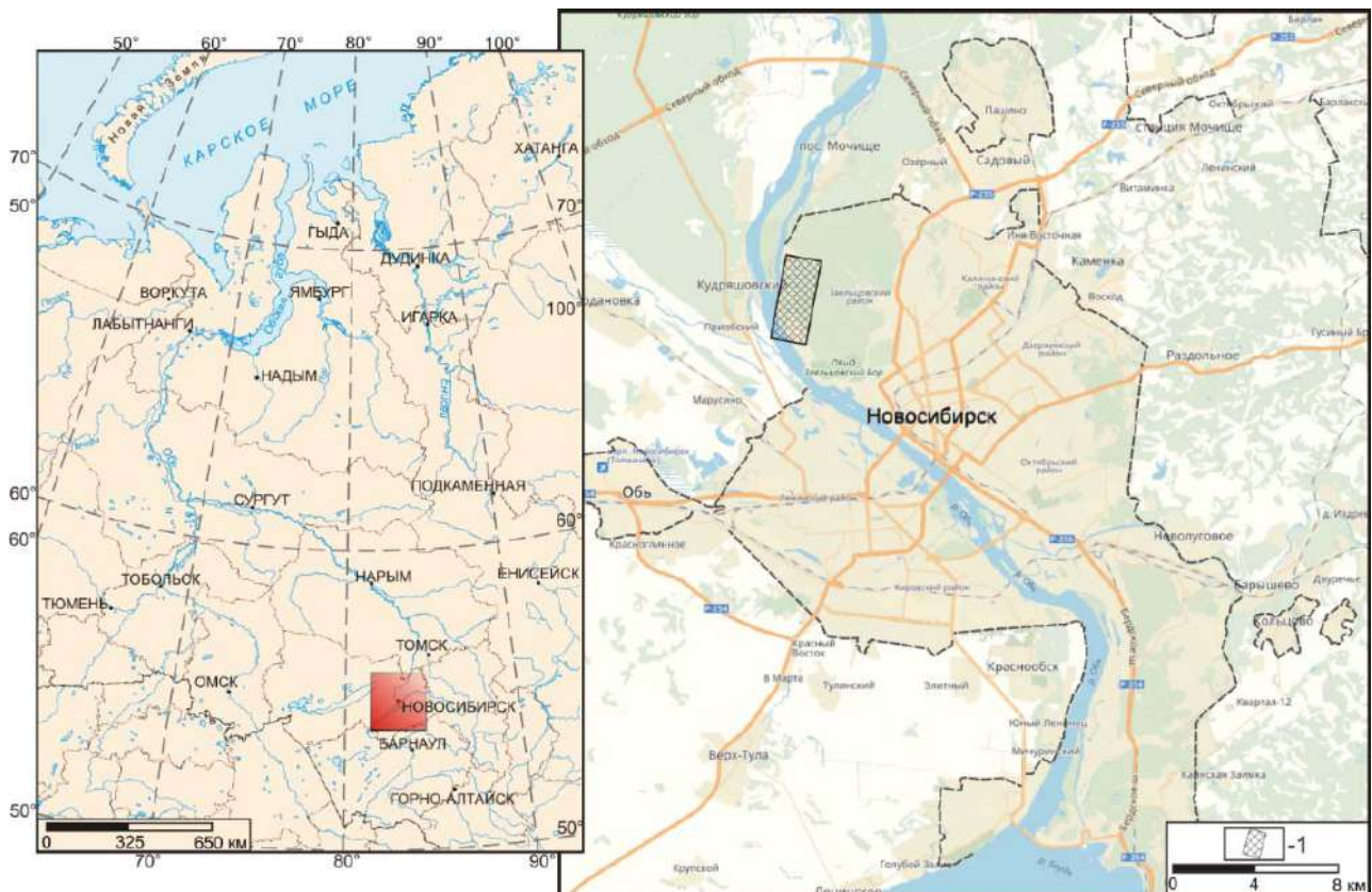
Рис. 1. Местоположение Заельцовско-Мочищенского проявления радоновых вод в пределах Новосибирской городской агломерации: