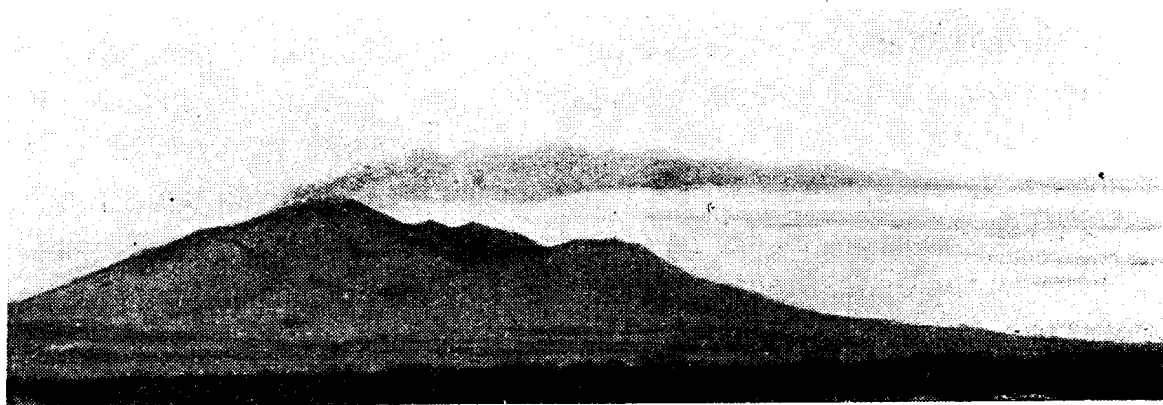
Рис. 1. Авачинская сопка на второй день извержения. Снято 29 марта 1926 г. Вид с NW.

С 29 марта по 2 апреля Авачинская сопка спокойно дымилась, из ее вершины шел мощной струей водяной пар, несколько серый от присутствия в нем мельчайшей вулканической пыли.