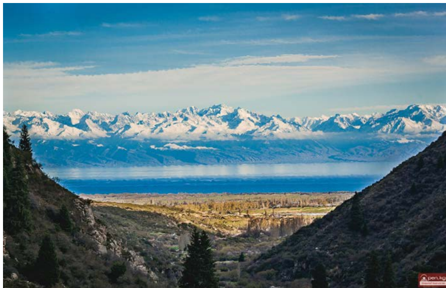
Рис. 1. Панорама Иссык-Кульского региона.

Иссык-Кульская котловина и окружающие её горы характеризуются первозданной красотой, лесистыми ущельями, мягким климатом, озером с чистой водой и прекрасными пляжами, огромными запасами лечебных грязей, минеральной и термальной водой, что создало региону мировую курортную и туристическую славу (рисунок 1).