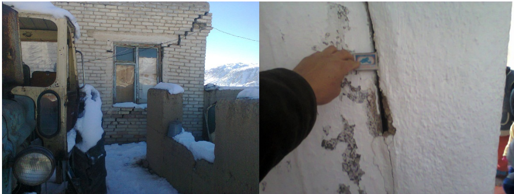
Рис. 3. Последствия Каджисайского землетрясения 2014 г. ( I_0=7 ) в пос. Коргон-Булак – 8 км к юго-востоку от эпицентра.

разработок здесь образовались горные отвалы радиоактивных пород, которые содержат более шестисот тысяч кубических метров заражённой массы, которая совместно с защитной дамбой испытывает влияние природных процессов: они подвергаются сотрясениям (например, последним Каджисайским землетрясением - 14.11.2014 г.; I_0=7 баллов, K=13.9 , M_{pв} = 6.1 ; рисунок 3 [5]), размыву, паводкам и селям, что приводит к выносу радиоактивных материалов на поверхность (отходы здесь засыпаны песком и рыхлым грунтом, а не забетонированы). Кроме того «могильник» выполнен без учёта фильтрации и других факторов, потому является потенциальным источником экологической опасности и загрязнителем южного побережья озера Иссык-Куль, да и всего водоёма. Угроза исходит также и от людей, которые проникают на территорию хвостохранилища, производят самостоятельно раскопки, собирают радиоактивные минералы и разносят их по округе.