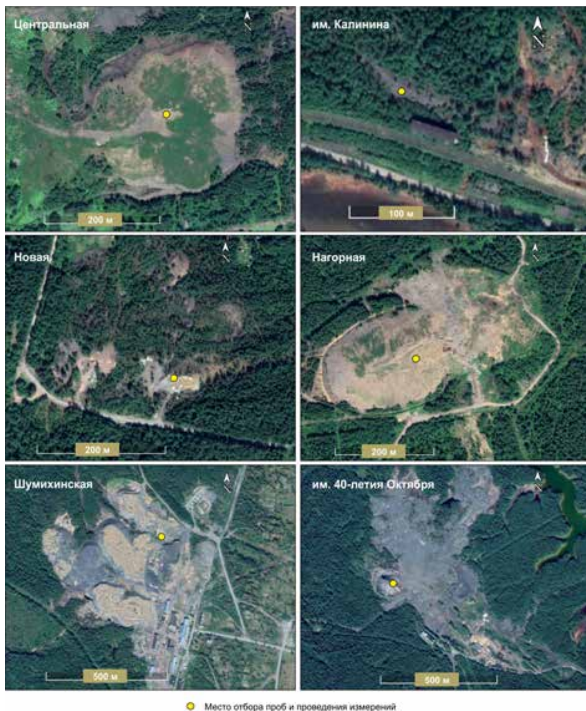
Рисунок 2. Космические снимки исследованных отвалов шахт Кизеловского угольного бассейна. Figure 2. Space images of the investigated dumps of the mines of the Kizelovsky coal basin.

автоматическими блоками детектирования, измеряющими мощность дозы гамма-излучения. Технические характеристики используемой аппаратуры соответствовали требованиям п. 4.3. МУ 2.6.1.2398-08.