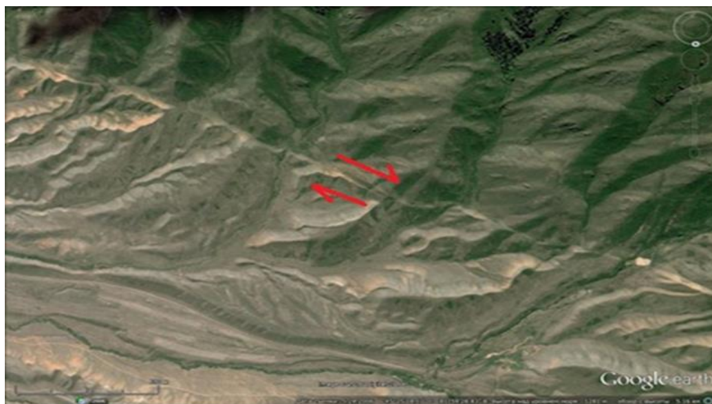
Рисунок 3. Активный разлом в долине р. Тохты. Отчётливо видны правосдвиговые смещения временных потоков до 50-100 м.

В долине Тохты разлом вновь выражен одним уступом, который протягивается вдоль южного борта впадины, подпруживает современные водотоки и смещает их по горизонтали на величину 50 - 100 м (рисунок 3). В западной части этой впадины нами закартирован короткий активный разлом, который смещает молодые формы рельефа и имеет все признаки дислокации, образованной в результате сильного сейсмического события (рисунок 4).