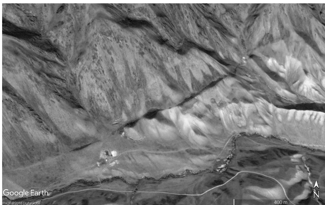
Рисунок 4. Вид на активный разлом, ограничивающий северный борт западной части Тохтинской впадины.

подпруживания водотоков уничтожены эрозией. Но и в этом случае свидетельства современной активности разлома сохраняются.