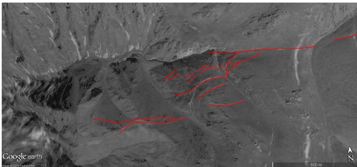
Рисунок 6. Короткие разрывы, сопровождающие Жамантас-Тохтинский разлом.

Как было указано выше, имеется несколько отрезков разломов, которые не образуют протяжённых зон, не имеют отчётливых признаков активности как большинство разрывов, составляющих описанные выше зоны, однако имеется несколько участков, где закартированы короткие поверхностные разрывы. Эти разрывы хорошо видны в рельефе, но сильно подвержены эрозионным процессам, что свидетельствует либо о длительных периодах повторяемости и/или о низкой скорости смещений. Один из таких разломов протягивается вдоль хребта Айракколь.