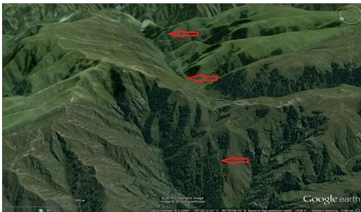
Рисунок 5. Отрезок Жамантас-Тохтинского разлома. Вид на восток из долины р. Лепсы на долину ручья Жамантас (левый приток р.Тентек. Слева – гора Жамантас (2133.4 м).

Иногда разлом сопровождается короткими разрывами, протяжённостью от 1.0 км до 2.5 км, одиночными или образующими связанные системы, имеющие структуру