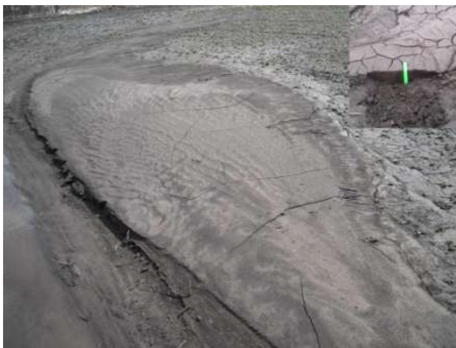
Рис. 2. Делювий на пашне Лучановского ключевого участка (2014 г.)

величину буферности, относится также щелочно-кислотная реакция (рН) среды, только корреляция между величинами рН и буферности обратная [9].