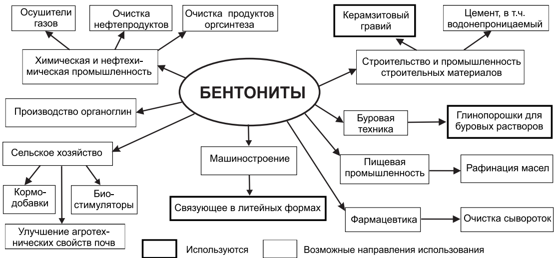
Рис. 1. Направления использования бентонитов Республики Татарстан.

В начале плиоценовой эпохи территория этого бассейна представляла собой возвышенную равнину, граничащую на востоке с Уральскими горами. По равнине протекала Палео-Белая с крупными притоками Палео-Камой и Палео-Волгой. Руслу этих палеорек были глубоко врезаны в донеогеновое ложе на 100-200 метров и более благодаря низкому стоянию базиса эрозии (Южно-Каспийская впадина). В познеплиоценовую эпоху трансгрессия Акчагыльского моря в Среднее Поволжье создала мощный подпор речным водам, течение рек резко замедлилось, стал отлагаться терригенный материал, приносимый с окружающей суши. В результате глубокие врезы русел и долин были выполнены продуктами ее размыва (песчано-глинистыми отложениями). Поэтому дно северного залива