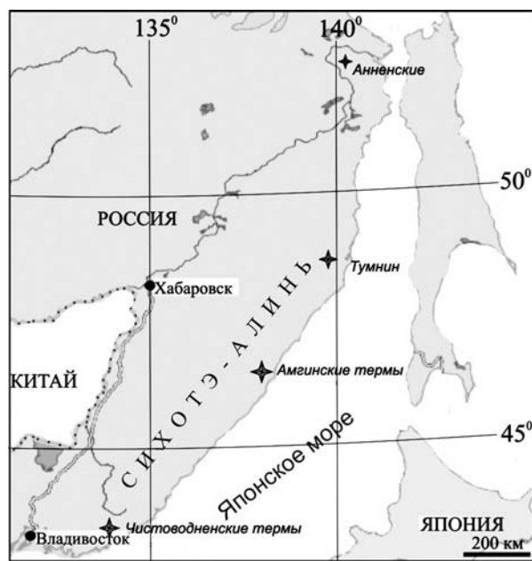
Рис. 1. Термальные воды Сихотэ-Алиня

Key words: nitric thermal waters, water geochemistry, gases in thermal waters.