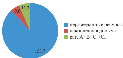
Рис. 1. Структура НСР газа Республики Кыргызстан на 01.01.2015, млрд м 3

По данным ОАО «ИГИРНИГМ» с учетом экспертной оценки ООО «Газпром ВНИИГАЗ», начальные суммарные ресурсы (НСР) газа Кыргызской Республики (ресурсного потенциала межгорных впадин) составляют 180,0 млрд м 3 . К началу 2015 г. текущие разведанные запасы газа составили 11,7 млрд м 3 , накопленная добыча – 9,6 млрд м 3 газа, неоткрытые ресурсы газа страны – 158,7 млрд м 3 (рис. 1). Основной причиной уменьшения остаточных (текущих) разведанных запасов газа