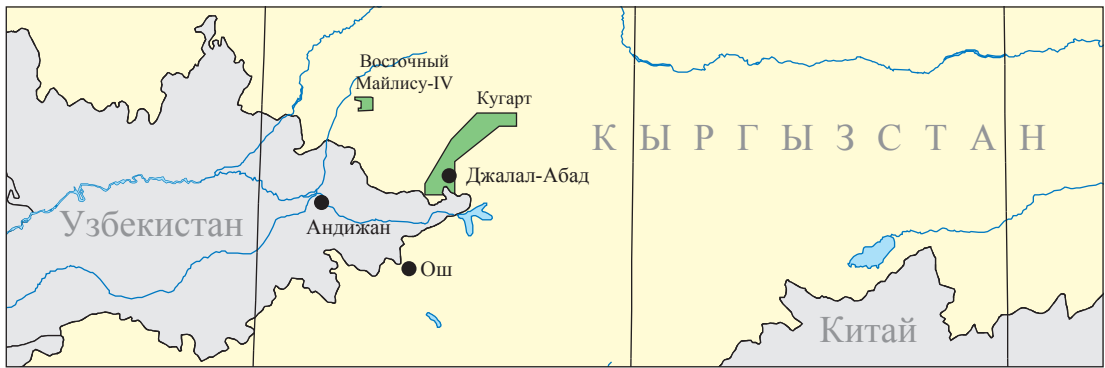
Рис. 2. Обзорная схема расположения лицензионных блоков ПАО «Газпром» (выделены зеленым цветом) в Кыргызской Республике