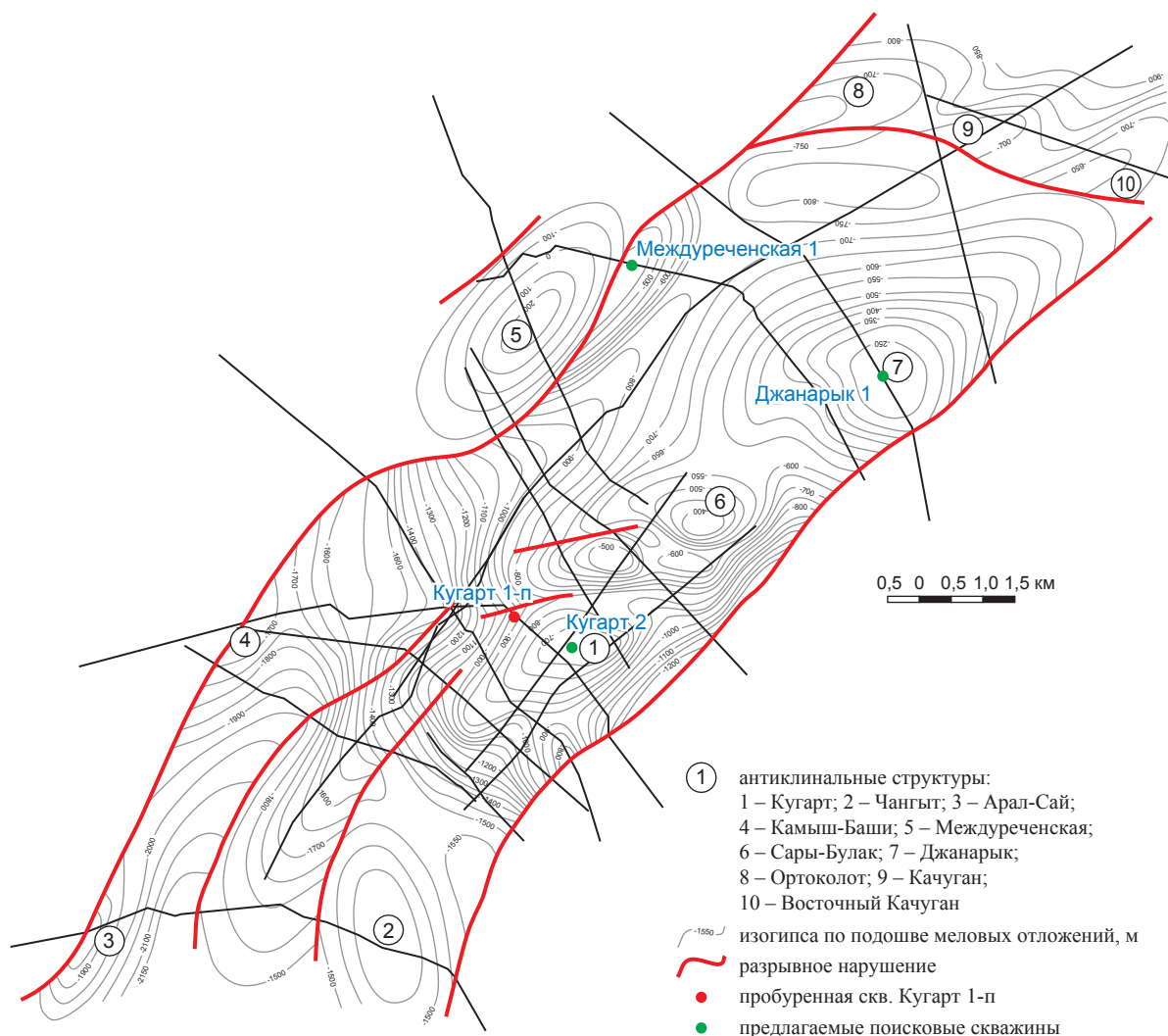
Рис. 4. Кугартский прогиб: структурно-геологическая карта по подошве меловых отложений

выделить Койташ и Кызкол. Амплитуда структур – 50–100 м.