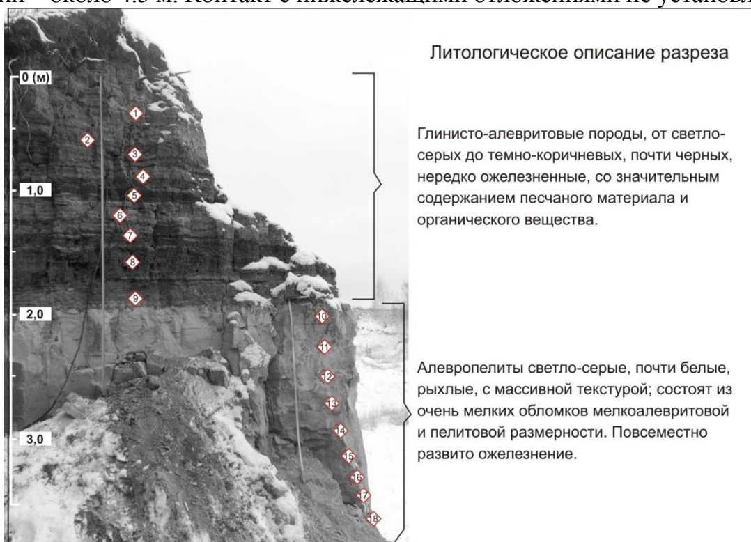
Рис. 2. Обнажение ишимской свиты у с. Масали

Литологическое описание разреза приведено на рис. 2. Видимая мощность отложений – около 4.5 м. Контакт с нижележащими отложениями не установлен.