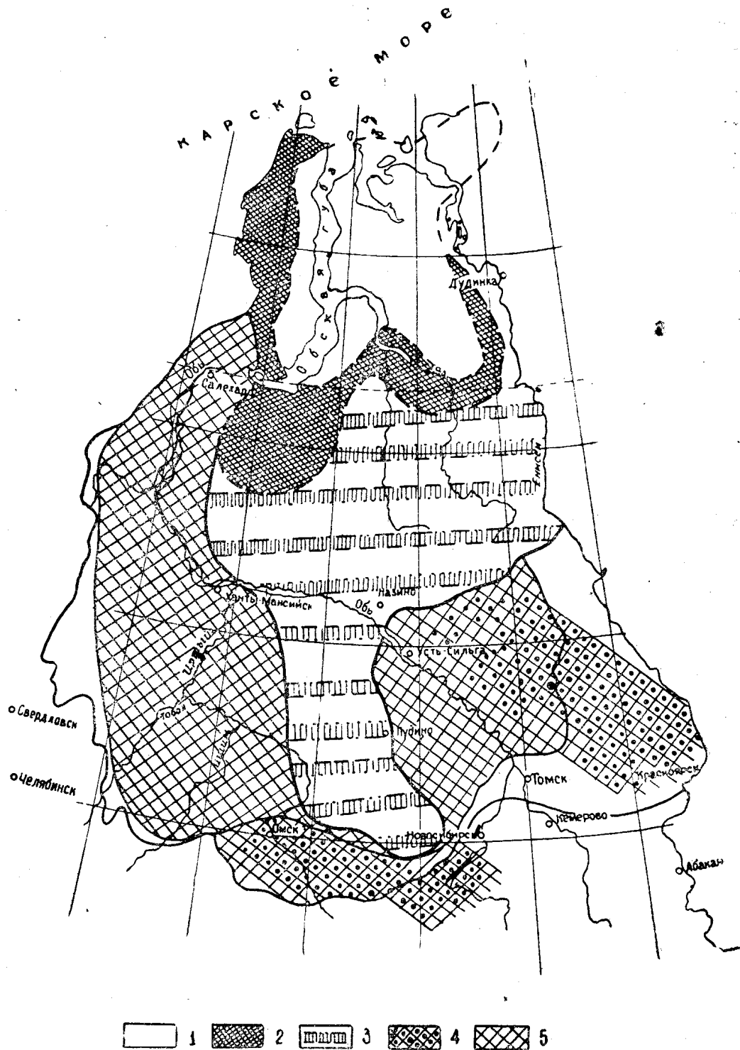
Рис. 1. Схематическая карта перспектив нефтегазоносности ниже-среднесюрских отложений Западно-Сибирской низменности.

Условные обозначения: 1 — морские глубоководные фации; 2 — морские мелководные фации; 3 — прибрежно-морские фации; 4 — угленосные площади в основном с углями пойменного генезиса; 5 — зона распространения литологических залежей нефти и газа.