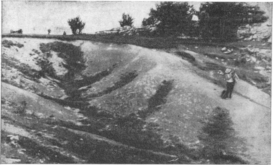
Рис. 1. Обнажение гравелитов на Чатырдаге

верхности. В восточном направлении конгломератовая свита погружается и у юго-восточного борта обнажается уже на 200—300 м ниже поверхности плато.