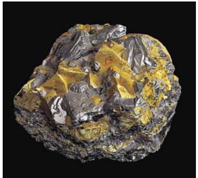
Двойники прорастания халькопирита с галенитом на сфалерите. Дальнегорск, Второй Советский рудник.