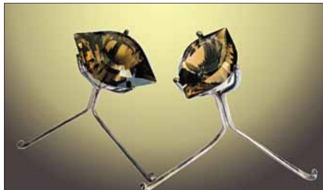
Морион (4,58 карат). Спасский район, ключ Шибановский.