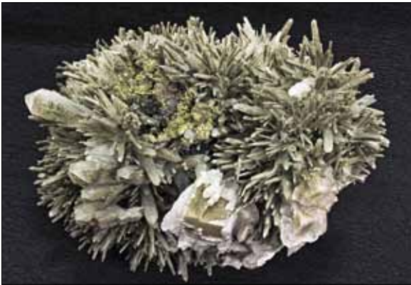
Друза длиннопризматических кристаллов кварца с присыпкой пирита; автоэпитаксия папиришпата по ромбоэдрическому кальциту. Дальнегорск, месторождение Николаевское.