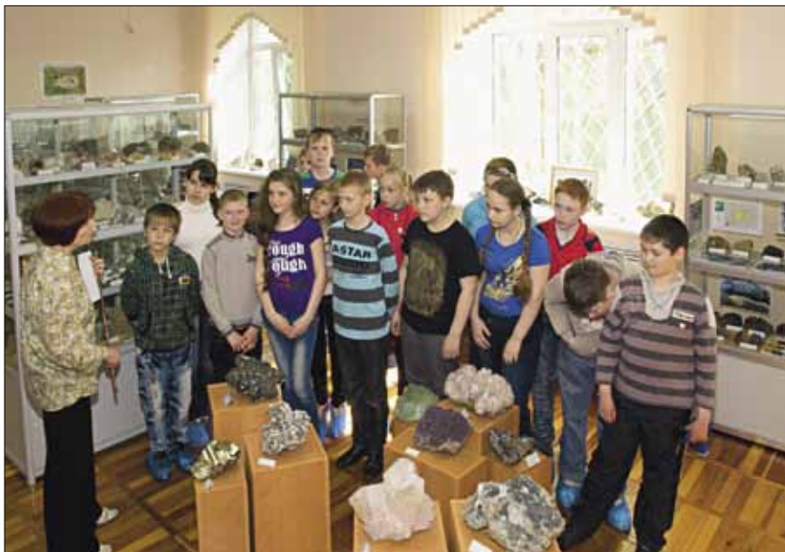
Экскурсия в Геолого-минералогическом музее Дальневосточного геологического института ДВО РАН.