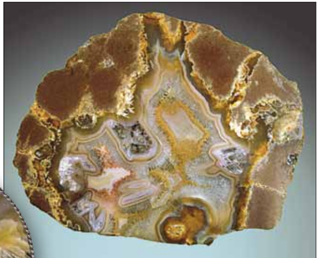
Агат пейзажный «Бабье лето». Партизанский район, Сергеевское месторождение.

и оптическим свойствам не уступающие топазу), морион, дымчатый кварц, вольфрамит и касситерит из камерных пегматитов Верхне-Шибановского месторождения (западный элемент Сихотэ-Алинской горной области). Для выставки огранены 22 образца камнесамоцветного сырья.