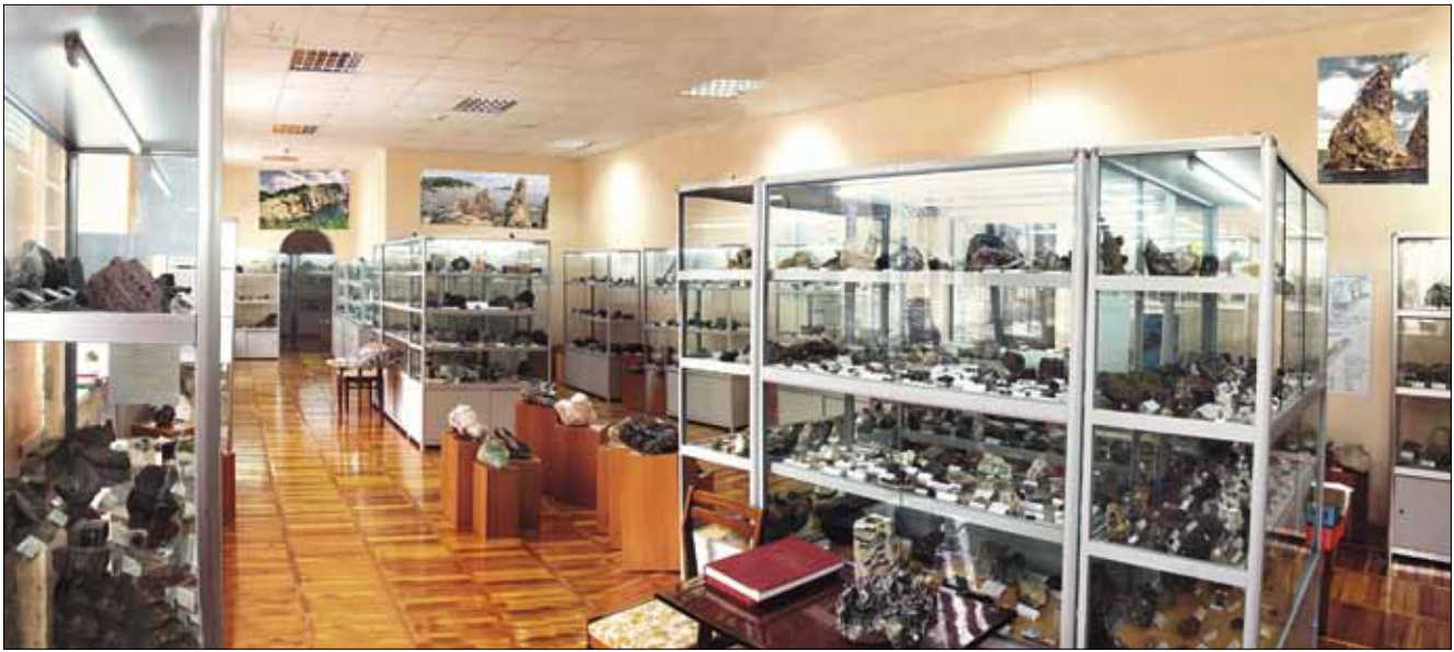
Экспозиция Геолого-минералогического музея Дальневосточного геологического института ДВО РАН.