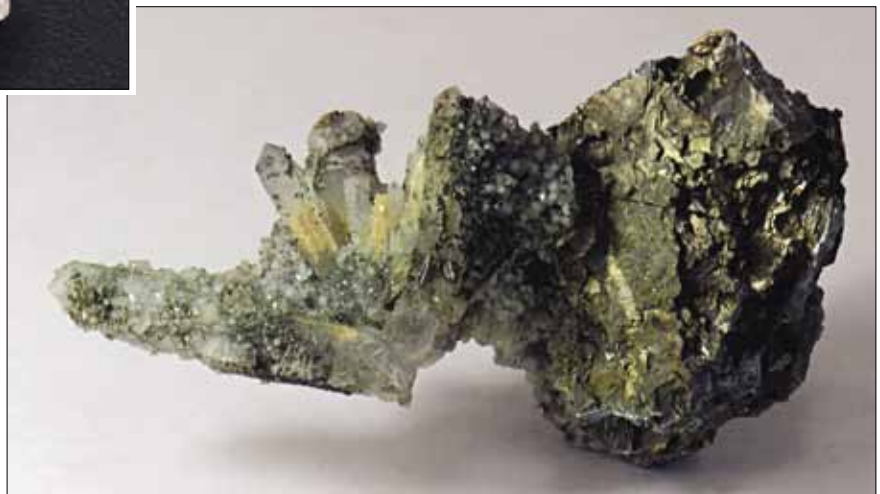
Кварц длиннопризматический слаборасщепленный с мелкими пирамидальными кристаллами кварца на гранях на пирротин-галенитовой подложке. Дальнегорск, месторождение Николаевское.