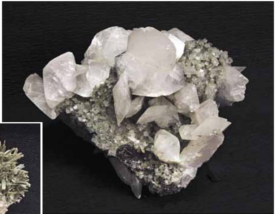
Крупные ромбоэдры кальцита на мелкокристаллической кварц-флюоритовой щетке. Дальнегорск, месторождение Николаевское.