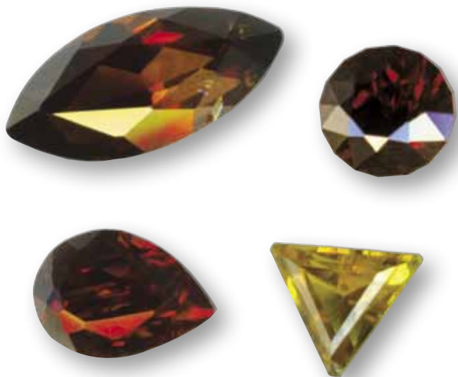
Цирконы (гиацинты от 0,45 до 0,89 карат и жаргон 0,30 карат) месторождения Незаметное.