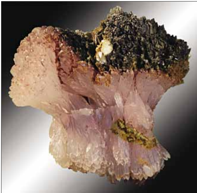
Снопивно расщепленный кристалл марганцовистого кальцита, частично покрытый пленками гидроокислов железа и марганца. Дальнегорск, месторождение Бор.