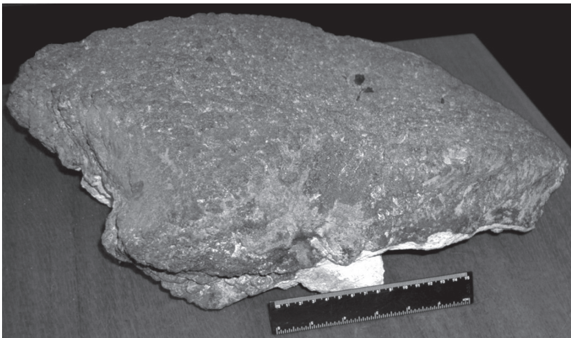
Рис. 2. Кобальтомарганцевая корка на рифогенном известняке. Гайот Вулканолог. Интервал драгирования 1800–1600 м